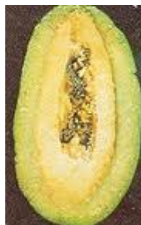
attaque sur fruit (génération carpophage)