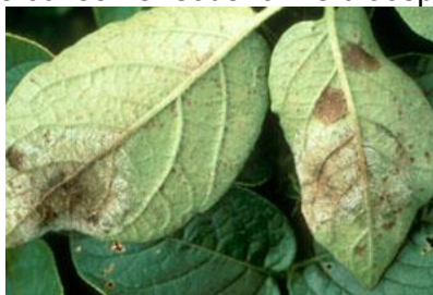
Attaques sur feuilles

Les spores du champignon peuvent tomber à partir des feuilles attaquées vers le tubercule et le sol où il peut se conserver sous forme d'oospores pendant 4-5 ans.