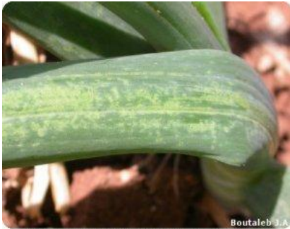
Dégâts caractéristiques de thrips sur oignon

Sur oignon de printemps, la culture en cours, le déprédateur accompagne son hôte depuis son installation jusqu'à l'approche de récolte. S'il n'est pas contrôlé, le thrips du tabac peut engendrer des dégâts pouvant aller jusqu'à 60 %.