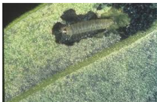
Larve sur feuille (génération phyllophage)