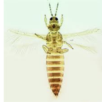
Adulte de T. tabaci .

* Lutte contre le thrips : le contrôle de ce ravageur est assez délicat du fait que :