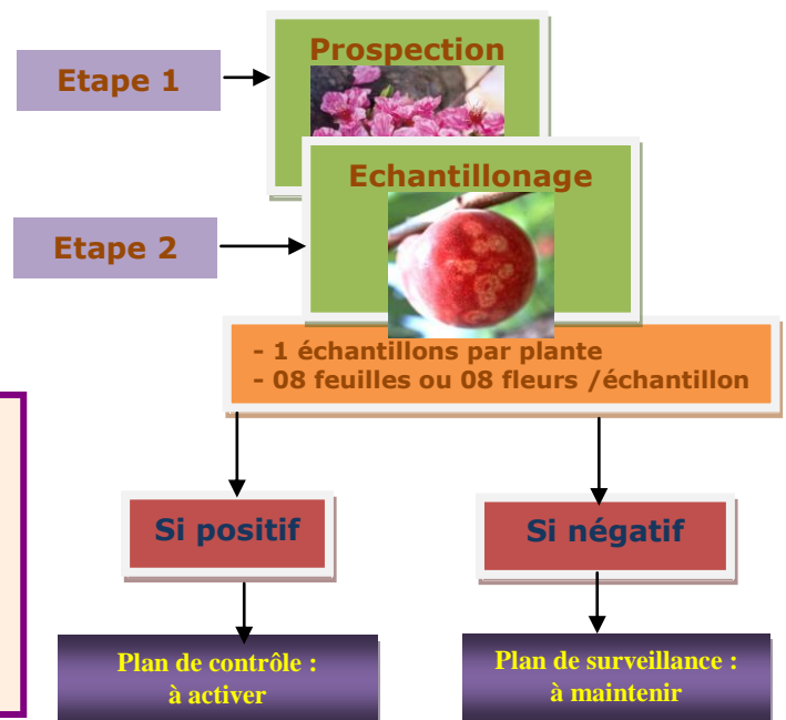
Figure 3 : Schéma du plan de surveillance de la sharka.

Quant au plan de contrôle de cette virose, il sera activé une fois la maladie est détectée dans la perspective de circonscrire la maladie le plus vite possible moyennant l'application de mesures de police phytosanitaire qui s'imposent.