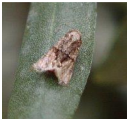
Adulte de la teigne

D'après le 1 er relevé, il s'est avéré que le seuil d'intervention est largement dépassé (400 à 500 papillons par piège). Face à cette situation, des avis de traitement ont été diffusés aux agriculteurs pour intervention, en parallèle le Service de la Protection des Végétaux de Khénifra poursuit ses tournées pour sensibiliser les agriculteurs afin de lutter contre ce ravageur.