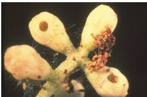
attaque sur bouton florale (génération anthophage)