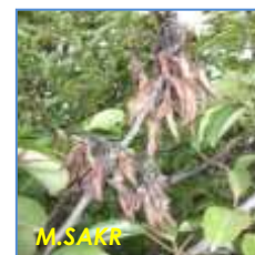
Fleurs de poirier atteintes de E. amylovora

Le tronc et les charpentières peuvent présenter des brûlures avec une formation de chancre. L'exsudat bactérien peut être observé sur les chancres, fruits, pédoncules des feuilles et des fleurs.