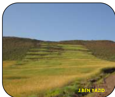
Culture céréalière en zone de Montagne

«...Ce bulletin se veut comme moyen de communication ayant pour objectif le partage des préoccupations des cadres de la Protection des végétaux avec les chercheurs et les professionnels et de servir comme plate forme de débat sur les enjeux de la PV dans la région de MTH TA de l'ONSSA»