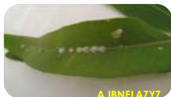
Attaques sur feuilles

Dans le cadre de la sensibilisation des partenaires sur l'importance de ce fléau, le Service a entrepris des contacts avec les partenaires locaux (Direction Provinciale des Eaux et forêts) pour les sensibiliser sur l'importance de la surveillance au niveau de la pépinière pour une fin de production de plants forestiers sains et indemnes de cet ennemi.