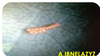
Œufs Glycaspis déposés en amas