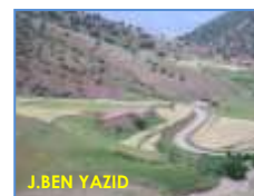
Micro-parcelles céréalières en zones de montagnes

Les Services Régionaux de la Protection des Végétaux(SRPV) assurent un suivi de près de la campagne céréalière afin d'être omni présents le long du processus de lutte et mettre à la disposition des céréaliculteurs un dispositif et un savoir faire en matière de la Protection Phytosanitaire