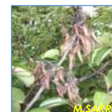
Exsudat sur poire dû à E. Amylovora