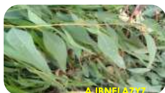
Dégâts sur Eucalyptus camaldulensis