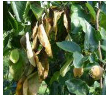
Photo n° 3 : symptômes sur feuilles